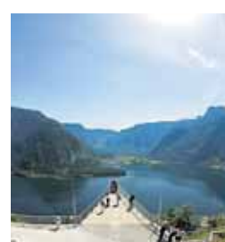
Auch die Region Dachstein gehört zur Wanderroute.